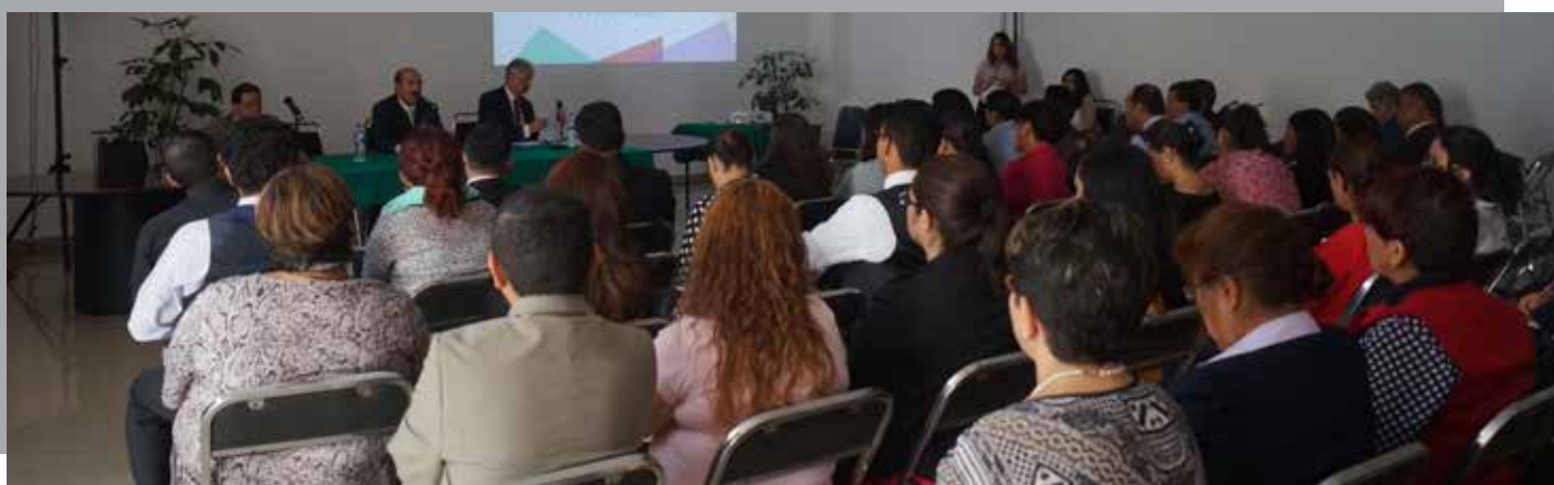
Participación del personal del INAPAM en las conferencias.

Por: El equipo de Auditoría para Desarrollo y Mejora de la Gestión Pública del OIC en el INAPAM*